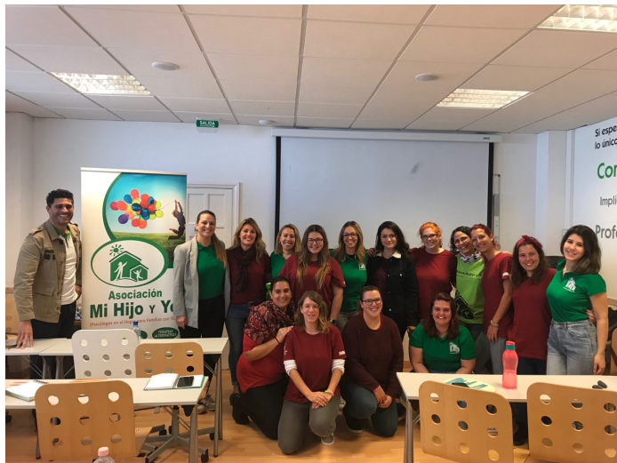
Equipo de la Asociación Mi Hijo y Yo y alumnado de 2º de MC